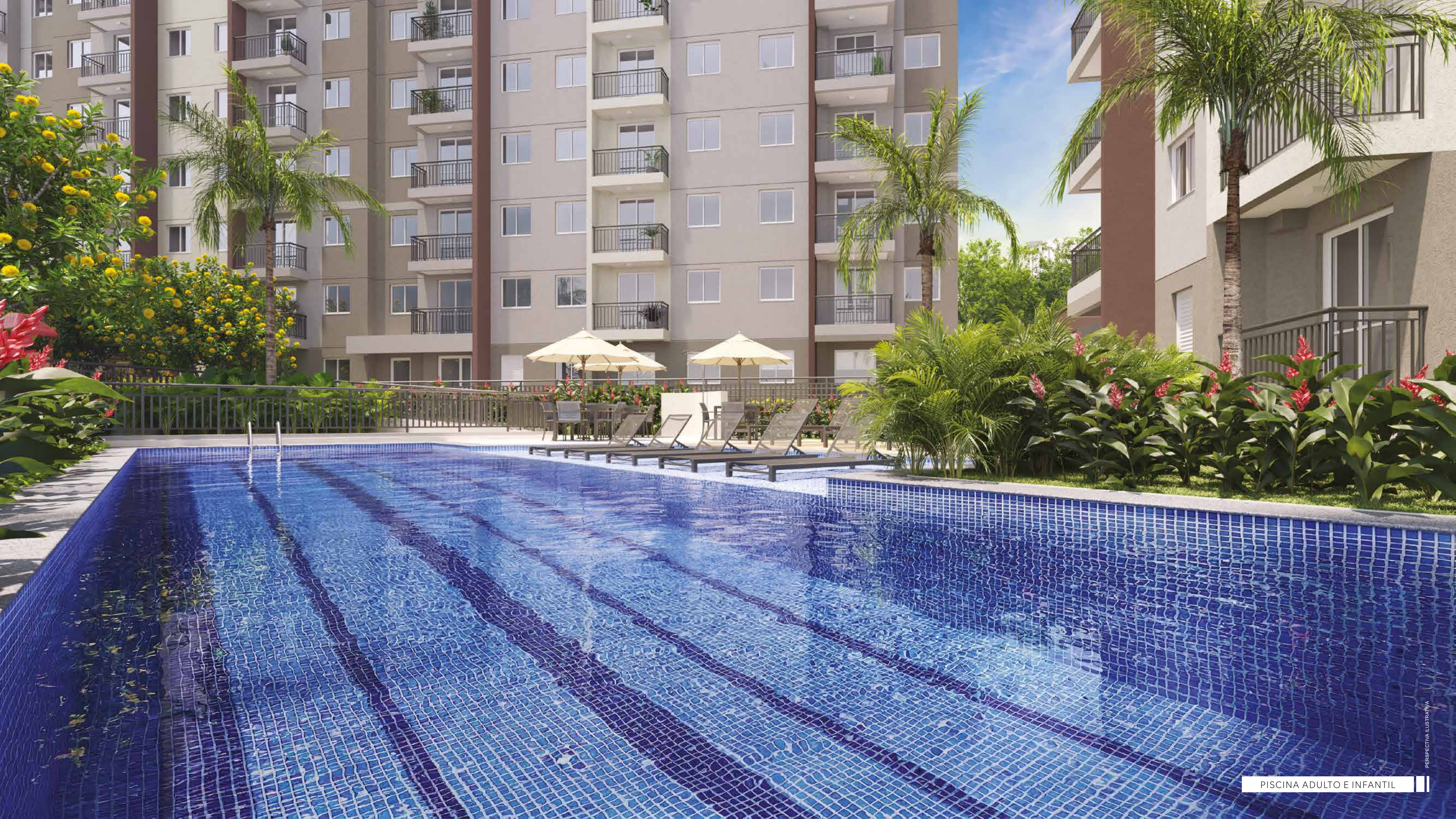
PISCINA ADULTO E INFANTIL